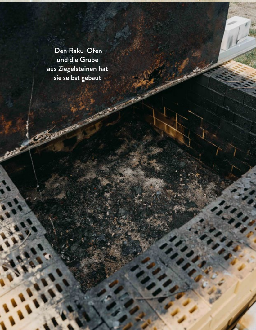
Den Raku-Ofen und die Grube aus Ziegelsteinen hat sie selbst gebaut